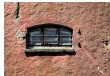
Cellfönster från straffängelset i Varberg.